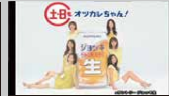
* サントリー / ジョッキ生 TV-CM