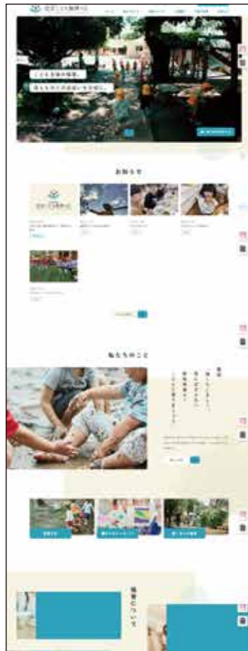
■認定こども園 錦ヶ丘 / 「Web サイト / PR 映像」