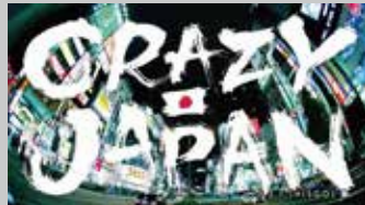
* H.I.S. / グローバル用 Web映像