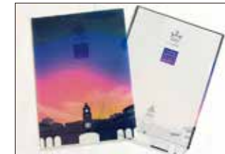
■純心大学 百合会 / ロゴ制作・クリアファイル制作