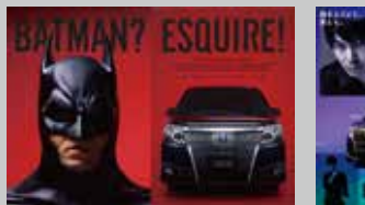
* TOYOTA / ESQUIRE GR 制作