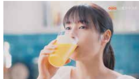
・日清オイリオ / 「mct オイル TV-CM」