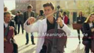
* アステラス製薬 / グローバル用 TV-CM