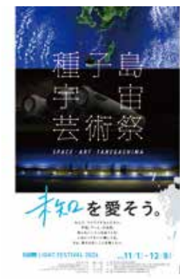
■種子島宇宙芸術祭 / 3連ポスター