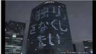
* 電通 / innovation 映像

2008年～2018年まで在籍した電通クリエイティブ/TUGBOATでのプロデュース作品の一例です。