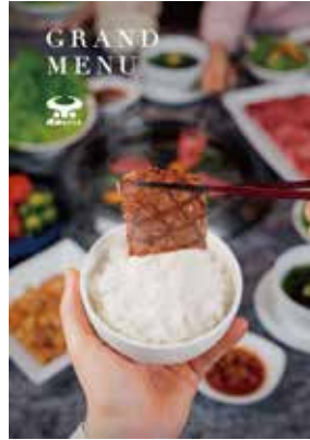
■焼肉なべしま / 「グランドメニュー」