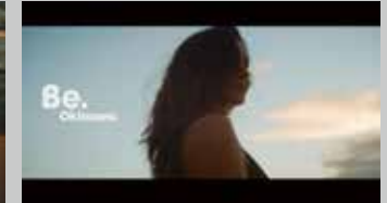
* 沖縄県 / グローバル / 国内 Web 用映像