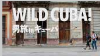
* H.I.S. / キューバ誘致 TV-CM