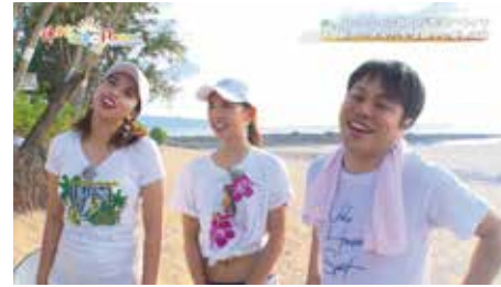
・KTS / 働き方改革 in Hawaii TV 番組