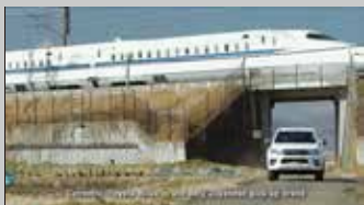
* TOYOTA Thai / HILUX Web用映像