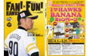
■Softbank Hawks 会報誌