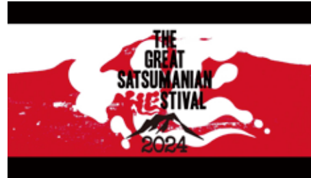
・GREAT SATSUMANIAN FESTIVAL2024 / TV-CM