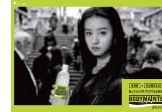
■大塚製薬 / BODY MAINTE GR プロデュース