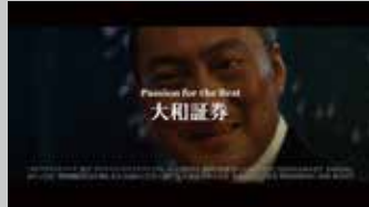
* 大和証券 / ファンドラップ TV-CM