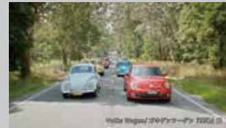
* フォルクスワーゲン / 企業 TV-CM