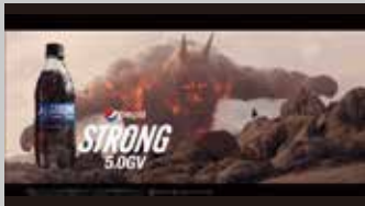
* サントリー / pepsi TV-CM