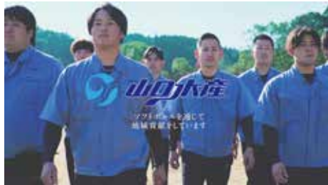
・山口水産 / 企業 TV-CM * 鹿児島広告協会 奨励賞受賞