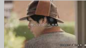
* LIFUL / HOME's TV-CM