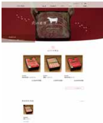
■肉の池澤 / 「ECサイト / Web サイト」