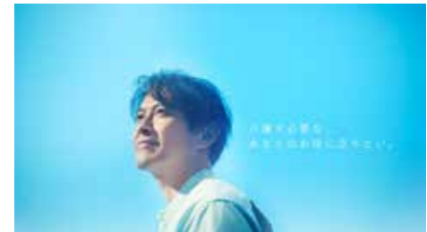
・ACG あおぞらケアグループ / 企業 TV-CM