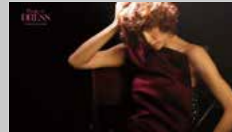
* gift / 雑誌 Dress 創刊 TV-CM