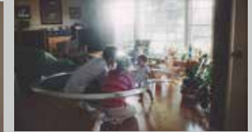
* SompohD / グローバル用 TV-CM