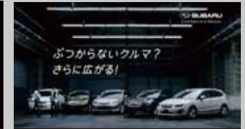
* 富士重工業 / eyesight TV-CM