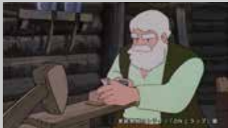
* TRY / 家庭教師のトライ TV-CM