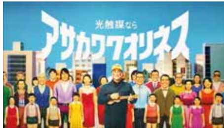
・アサカワオクリネス / 企業 TV-CM