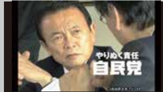
* 自由民主党 / TV-CM