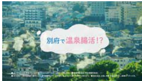
・別府市 × 明治ブルガリアヨーグルト / TV-CM