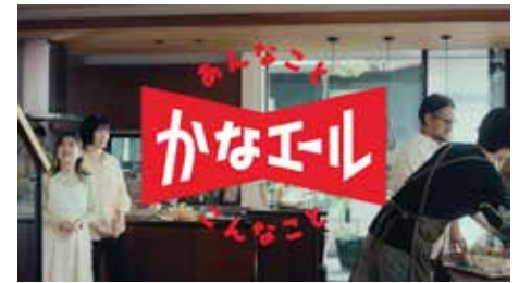
・鹿児島銀行 / 個人ローン TV-CM * 鹿児島広告協会 優秀賞受賞