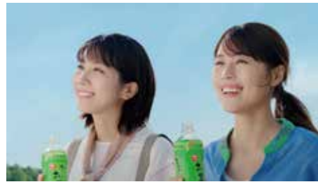
・伊藤園 / 「おーいお茶」 TV-CM