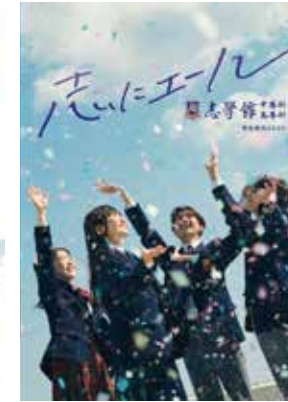
■志学館中・高等部 / 「学校案内パンフレット」