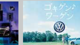
* フォルクスワーゲン / GR 制作