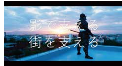
・明興テクノス / TV-CM 「影武者」 篇