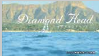
* ハワイ州観光局 / Web用映像