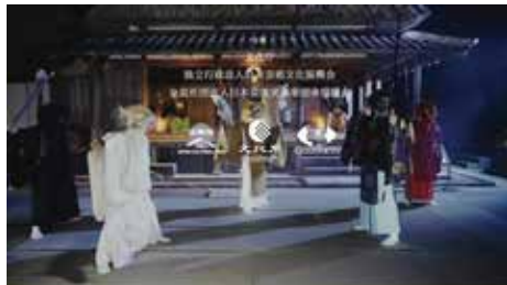
・文化庁 / 入来籬 PV