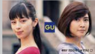
* ファーストリテイリング / GU TV-CM