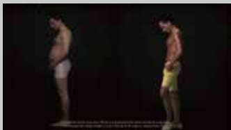
* RAIZAP / グローバル用 TV-CM