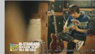
* スカパー! / HI-STANDARD TV-CM