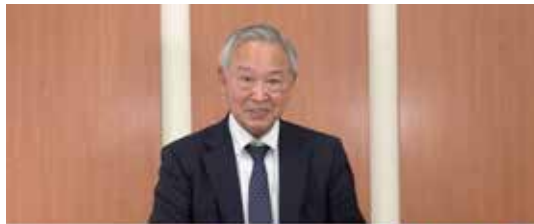
■ラ・サール学園 / オンライン学校説明会 →東京・福岡・鹿児島を結ぶハイブリッドイベント

先代が事業立上げから40年以上のノウハウを活かしたイベント企画・運営を行います。大規模イベントから、周年事業、還暦祝いなど実績が多数あります。そこに現社長の知見が組み合わさり、予算に応じた新しいイベント演出の方法をご提案いたします。昨今のオンラインを私用したハイブリッドイベントの知見もあり、映像や、デザインを含めて、トータルでご提案いたします。