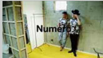
* Numero Japan / Web用映像