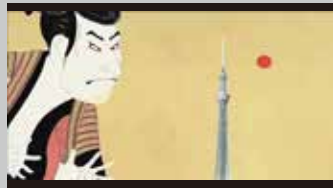
* 大林組 / 企業TV-CM