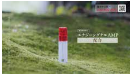
・大塚製薬 / 「インナーシグナル 通販番組」

東京支社の知識を活かして、他社とは異なるプロデュース力で、予算に応じた高品質の映像制作を行います。